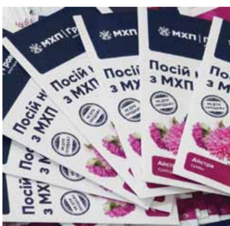
ПОСІЙ НАСІННЯ З МХП