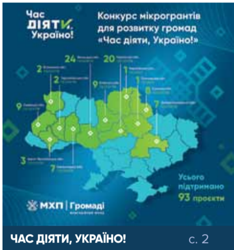
ЧАС ДІЯТИ, УКРАЇНО!