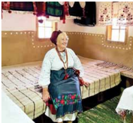
МХП ВІДРОДИТЬ МУЗЕЙ