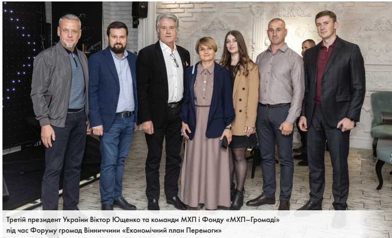
Третій президент України Віктор Ющенко та команди МХП і Фонду «МХП-Громаді» під час Форуму громад Вінниччини «Економічний план Перемоги»

Осінь 2023 року стала врожайною на форуми і конференції міжнародного та національного рівня, присвячені відбудові України, перспективам вітчизняного агросектору, забезпеченню продовольчої безпеки. Яке бачення мають експерти і менеджери МХП? Які виклики вважають найскладнішими і які надають пропозиції для їх подолання?