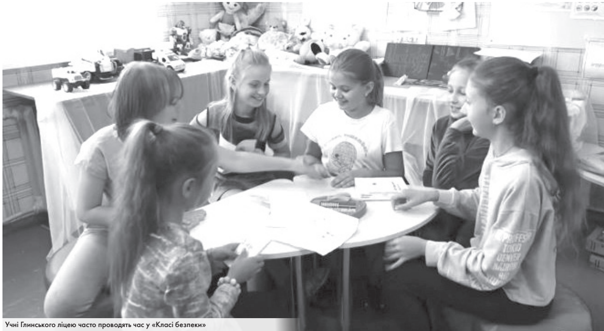
Учні Глинського ліцею часто проводять час у «Класі безпеки»