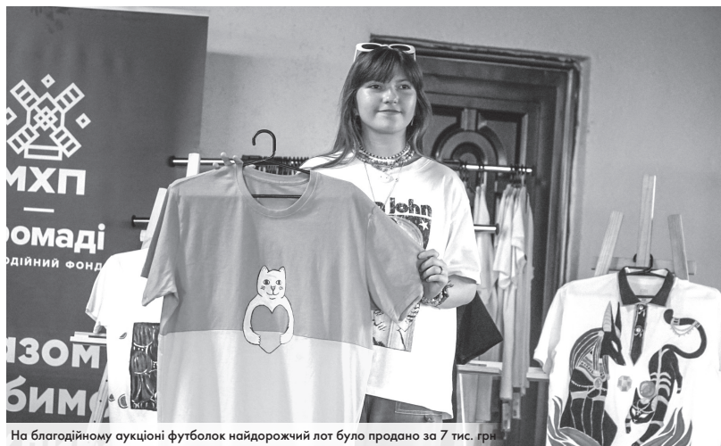
На благодійному аукціоні футболки найдорожчий лот було продано за 7 тис. грн.

ЯК ТВОРЧИСТЬ ТА СПОРТ ДОПОМАГАЮТЬ ЗБИРАТИ КОШТИ НА ПОТРЕБИ НАШИХ ЗАХИСНИКІВ