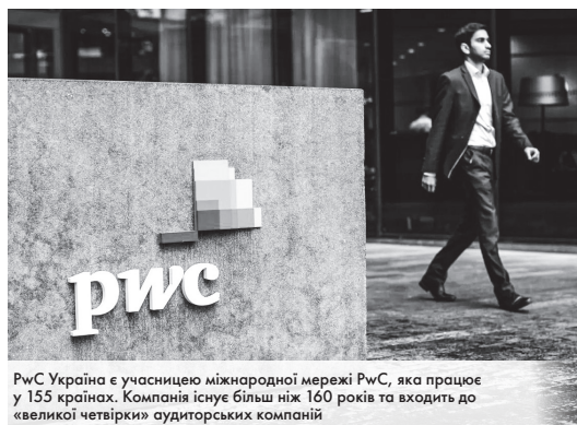
PwC Україна є учасницею міжнародної мережі PwC, яка працює у 155 країнах. Компанія існує більш ніж 160 років та входить до «великої четвірки» аудиторських компаній

Фонд «МХП-Громаді», що з 2015 року комплексно відновлює та розвиває українські громади, отримав аудиторський звіт від міжнародної аудиторської компанії PwC в Україні. Аудит був проведений за