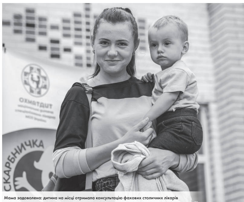
Мама задоволена: дитина на місці отримала консультацію фахових столичних лікарів

Окрім того, після таких виїздів менеджери «МХП-Громаді» спільно з лікарями ініціювали кампанію #нечкайзчекапом, в межах якої закликають батьків частіше водити дітей на профілактичні огляди. Адже стрес та війна провокують хвороби, які складно виявити на ранній стадії в дітей, навіть якщо вони не проживають біля лінії фронту чи не були в окупації. Тому, щоб убезпечити й зберегти дитяче здоров'я — провідні медики України закликають українців не чекати з перевіркою та записуватися на огляди дітей.