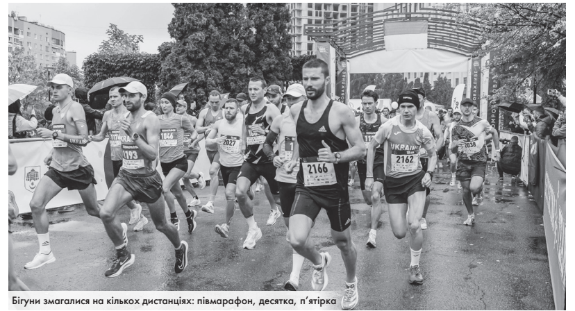
Бігуни змагалися на кількох дистанціях: півмарафон, десятка, п'ятірка