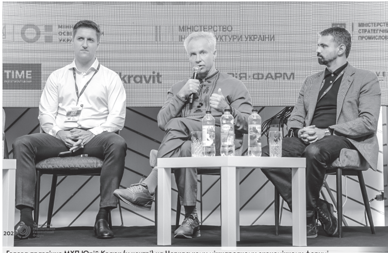
Голова правління МХП Юрій Косюк (у центрі) на Черкаському міжнародному економічному форумі